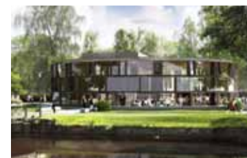
Nu är det klart att orangeriet i Stadsparken ska byggas.

...energi att bo tätt än att bo glest. Om vi vill få ner koldioxidförbrukningen per invånare är ett tätt samhälle ett positivt samhälle. Sedan finns det marknadskrafter som respekterar vad folk vill", säger Gert Wingårdh.